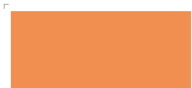
9922 | aprikose . apricot