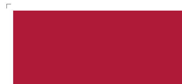
9675 | chili . chili