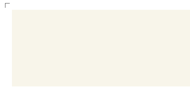
9937 | mond . moon