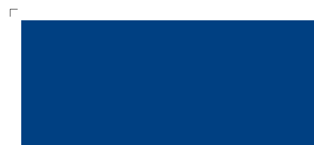
9545 | mitternacht . midnight