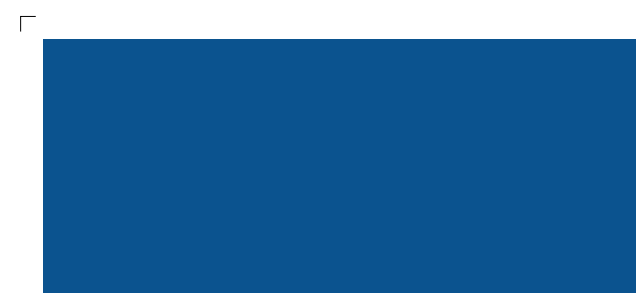
9965 | atlantik . atlantic