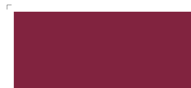
9879 | merlot . merlot