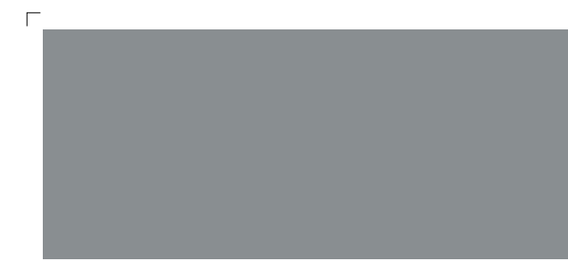
9665 | gewitter . thunderstorm