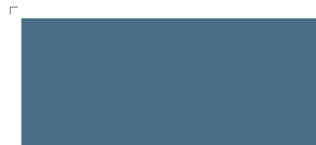
9866 | heidelbeere . blueberry