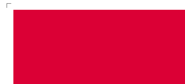
9671 | tomate . tomato