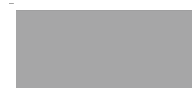
9801 | beton . concrete