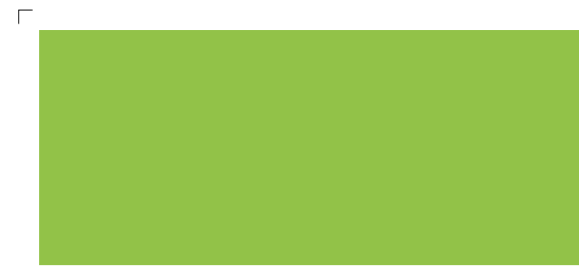
9926 | limette . lime