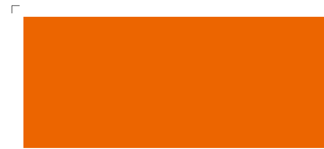
9527 | karotte . carrot